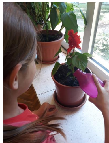
Pripremila: Sandra Podrug