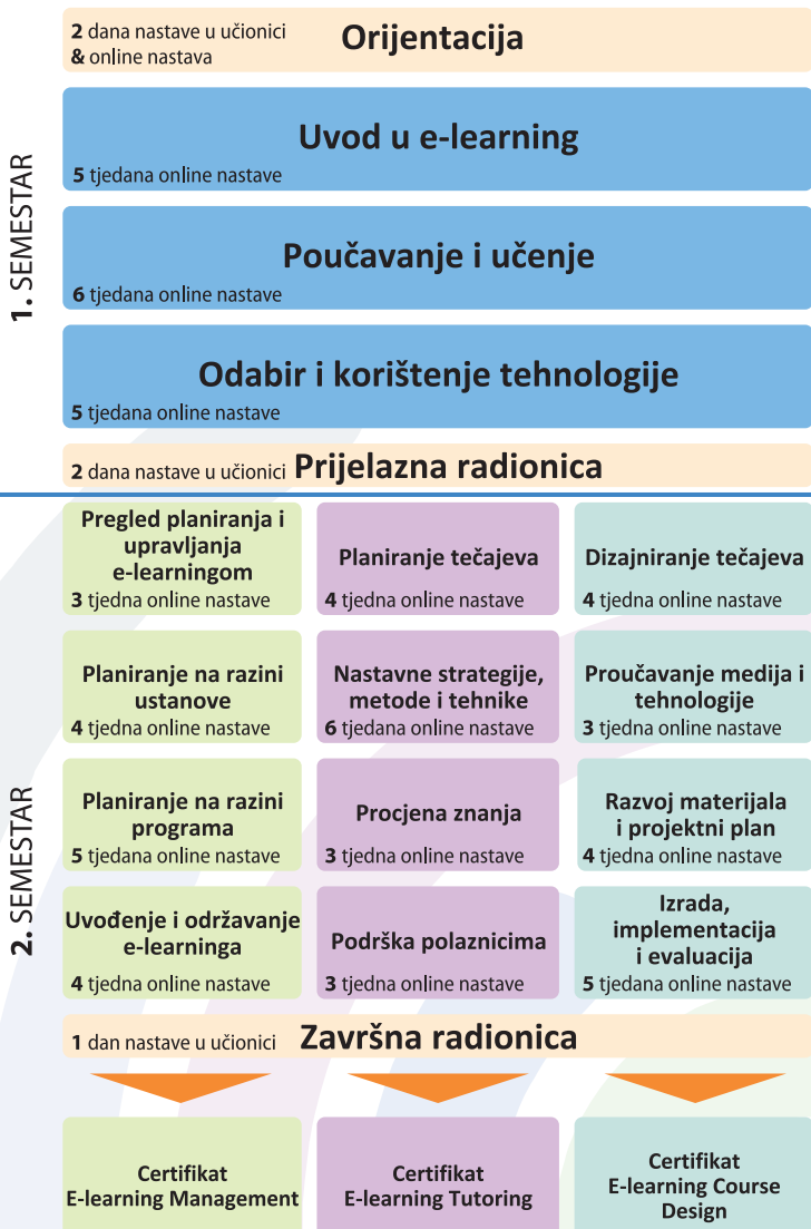
Shema programa E-learning akademije

Sva tri programa započinju zajedničkim temeljnim kolegijima u prvom semestru, dok se drugi semestar sastoji od kolegija koji se bave temama specifičnim za pojedini program.