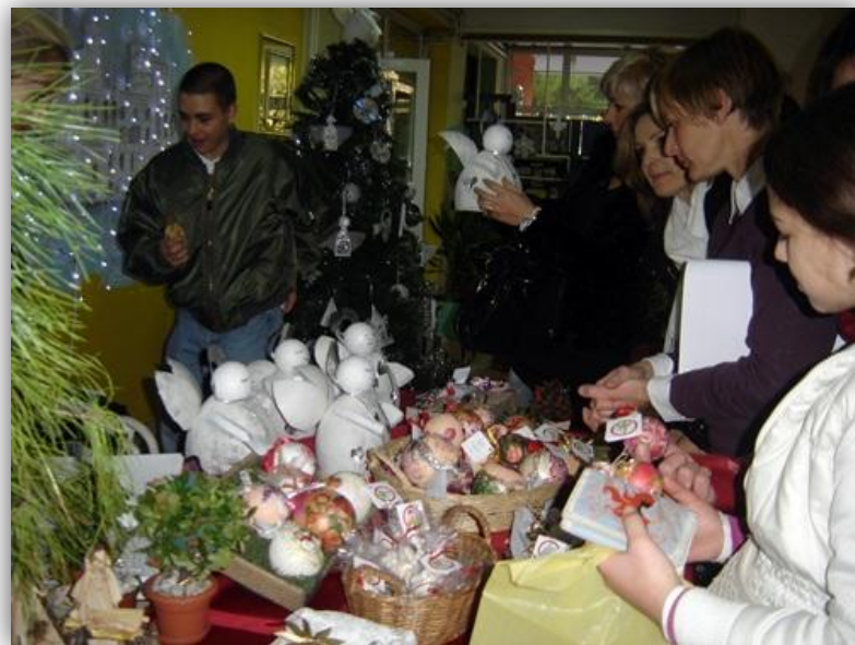
ŠKOLSKI BOŽIĆNI SAJAM